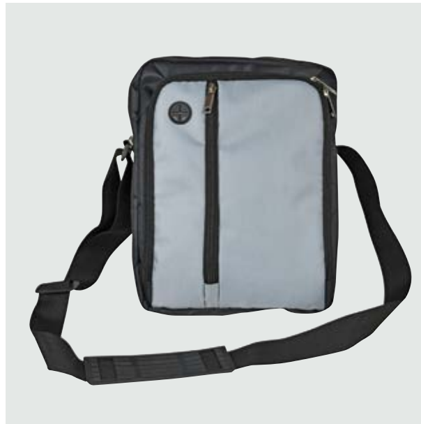
MAL 528 Bandolera Baggio

Material: Polyester Medida: 27.5 x 20 x 5.5 cm.