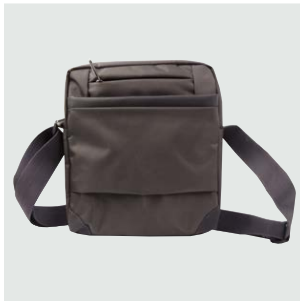
MAL 522 Bandolera Ronaldo

Material: Polyester Medida: 25 x 22.5 x 4.5 cm