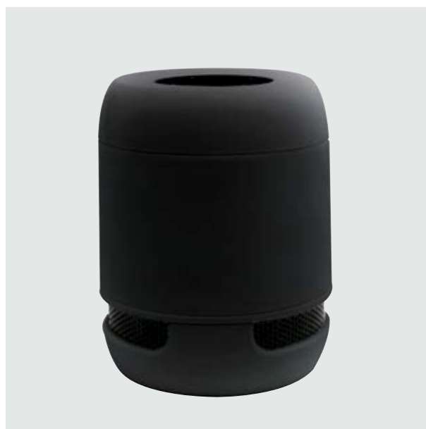
TEC 45 Bocina Marconi