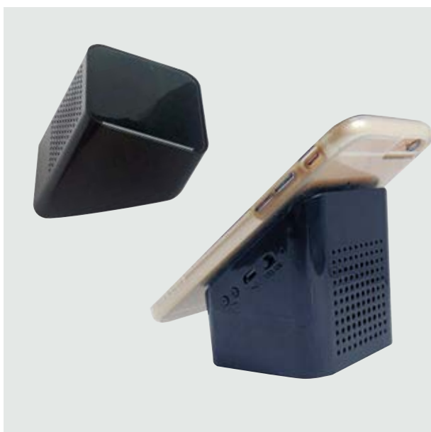
TEC 42 Bocina Dunlop