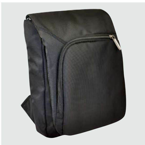
MAL 525 Crossbody Robinson

Material: Polyester Medida: 26 x 21.5 x 4.5 cm.