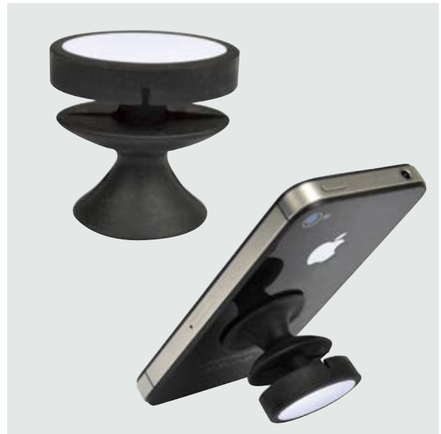
TEC 19 Stand Boyle