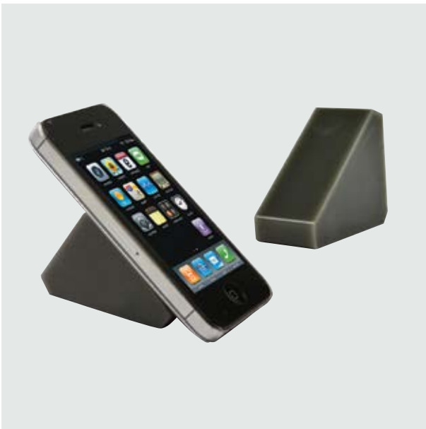
TEC 20 Tri Stand