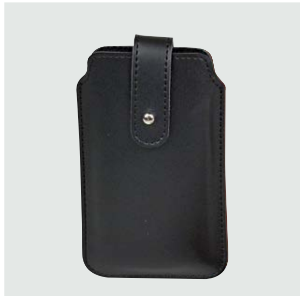
TEC 26 Phone-Case